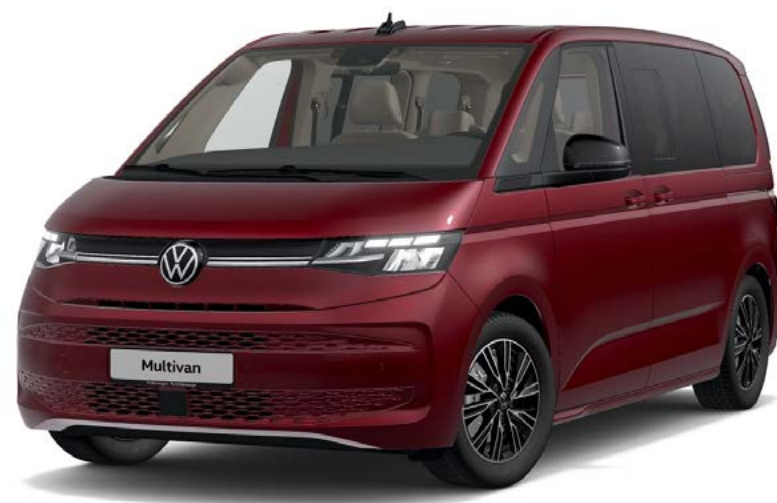
1 Jantes en alliage léger «Dundrod»